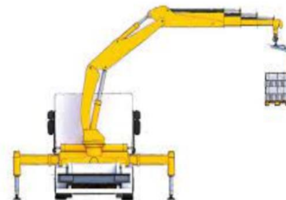
Avant : 2m75 / Arrière : 1m85

TLM 2008 TRANSPORT - LEVAGE - MANUTENTION